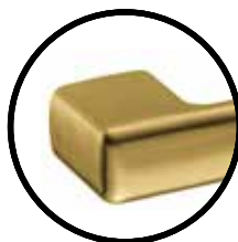
.TG TITANIUM GOLD