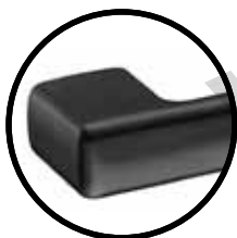
.TB TITANIUM BLACK

Outros acabamentos/ Other finishes/ Otros acabados