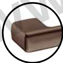
.TCH TITANIUM CHOCOLATE