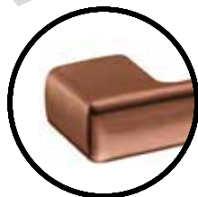
.TCO TITANIUM COPPER